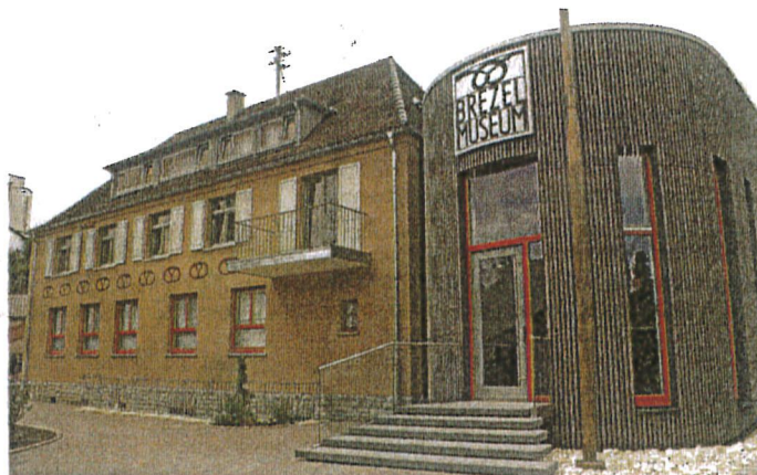
Das Brezelmuseum erzählt die Historie des beliebten Gebäcks.

Die Sanierung samt Anbau erfolgte unter ökologischen Gesichtspunkten und die Heimatverbundenheit Huobers zeigt sich beispielsweise am Außenputz: Zum Einsatz kamen hier Erdpigmente aus der Umgebung. Erdmannhausen hat durch das Museum nun auch ein neues Wahrzeichen: Die weithin sichtbare, 16 Meter hohe Stahlskulptur „Weizenähre“, gestaltet vom renommierten Künstler Paul Fuchs, strebt golden dem Licht ent-